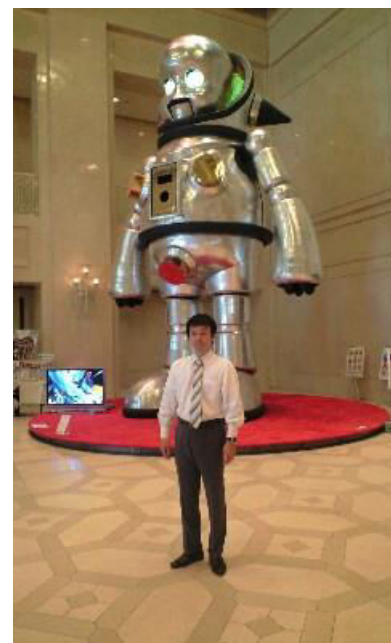
大阪市役所ロビーにて