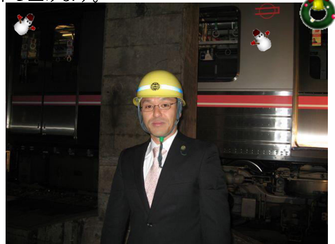
終電後の地下鉄千日前線にて

さて、秋から冬にかけて市内では防災訓練がたくさん行われると聞いています。私も先日の10月25日の浪速連合の防災訓練と10月31日に終電後の地下鉄桜川駅～難波駅間で浪速消防署・浪速警察署、機動隊等・交通局合同の計220名での列車火災を想定した訓練に参加してきました。これらの訓練を通じて、生命と財産を守る重要性を再認識しました。また、浪速区は非常に防犯意識の高い区ですが、訓練に参加している区民のみなさんの活動を拝見していますとさすがに感心させられます。私もみなさまと共に更なる防犯意識の向上にがんばりたいと思います。