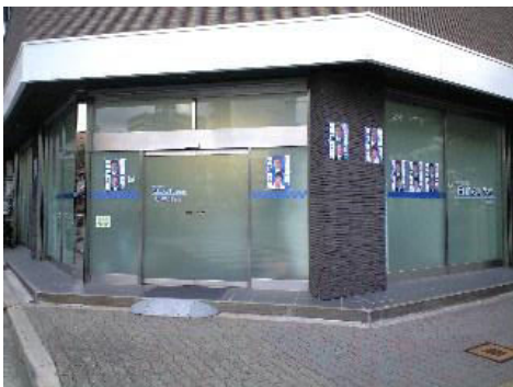
森山事務所の外観と内観

国会議員の先生方にも国民の生活第一の初心に戻り、国民生活を守る政策実現のために与野党もしくは幅広くは団結してもらうように今年も発信して行きます。