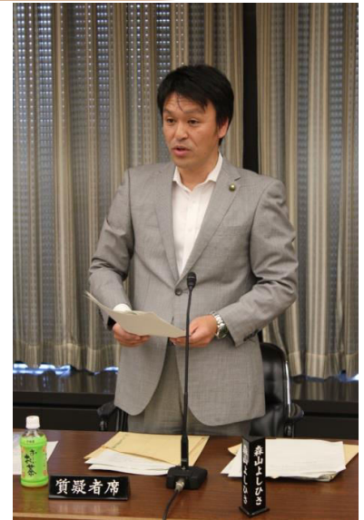
10月26日決算特別委員会で

だれが考えたのでしょうか？、私たちの意見は反映されるのでしょうか？11月3日大阪市を5区と7区に解体する案が提示されましたが11月5日での区長会議で反対が相次ぎ、決定先送りとなりました。そして、11月9日には7区案の一部修正が行われました。このような状態が続く中で市民は振り回され、そして区民どうしの対立意識の助長に繋がるのではと懸念されます。