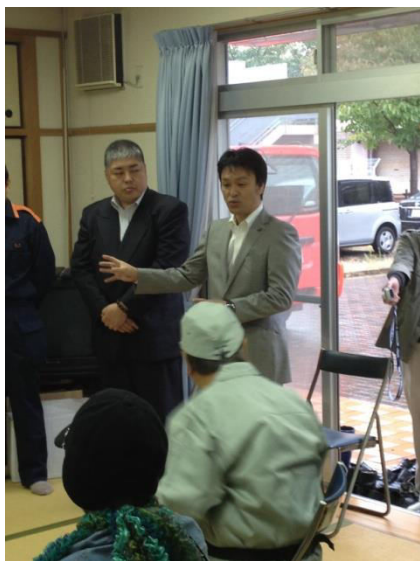
防災リーダー講習会で浪速区長と