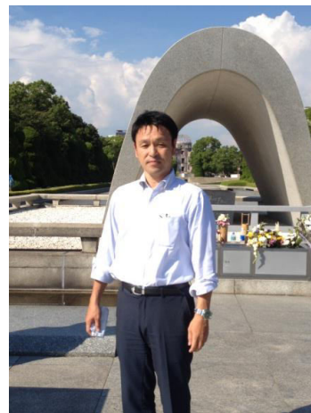
広島平和記念公園にて

人間が造り出した原子爆弾や放射能の恐ろしさを再認識させられ、次世代へ語り継ぎ、平和な世界の構築を目指さなくてはならないと真に思い、黙祷を捧げてきました。